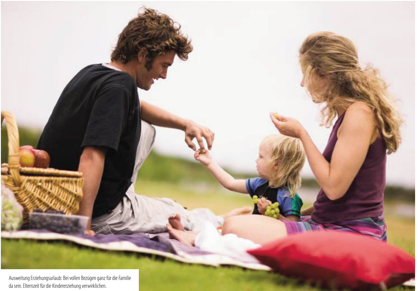
Ausweitung Erziehungsurlaub: Bei vollen Bezügen ganz für die Familie da sein. Elternzeit für die Kindererziehung verwirklichen.