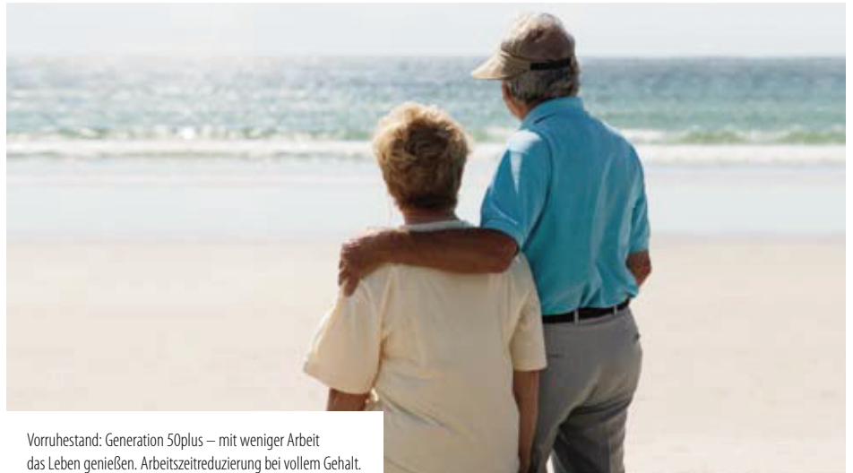
Vorruhestand: Generation 50plus – mit weniger Arbeit das Leben genießen. Arbeitszeitreduzierung bei vollem Gehalt.

den. Nach einer aktuellen Studie würden 84 Prozent der deutschen Arbeitnehmer gerne früher als mit 67 Jahren in Rente gehen. Dass nur jeder Fünfte von ihnen bisher ein Zeitwertkonto hat, verdeutlicht den enormen Handlungsbedarf.