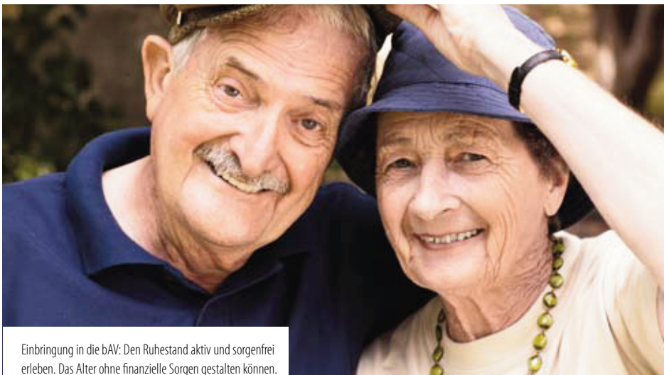
Einbringung in die bAV: Den Ruhestand aktiv und sorgenfrei erleben. Das Alter ohne finanzielle Sorgen gestalten können.

Deshalb kann allen Unternehmen, Personalverantwortlichen sowie den Steuer- und Wirtschaftsberatern die intensive Beschäftigung mit dem Thema „Zeitwertkonten und Lebensarbeitszeitmodellen“ nur dringend empfohlen werden.