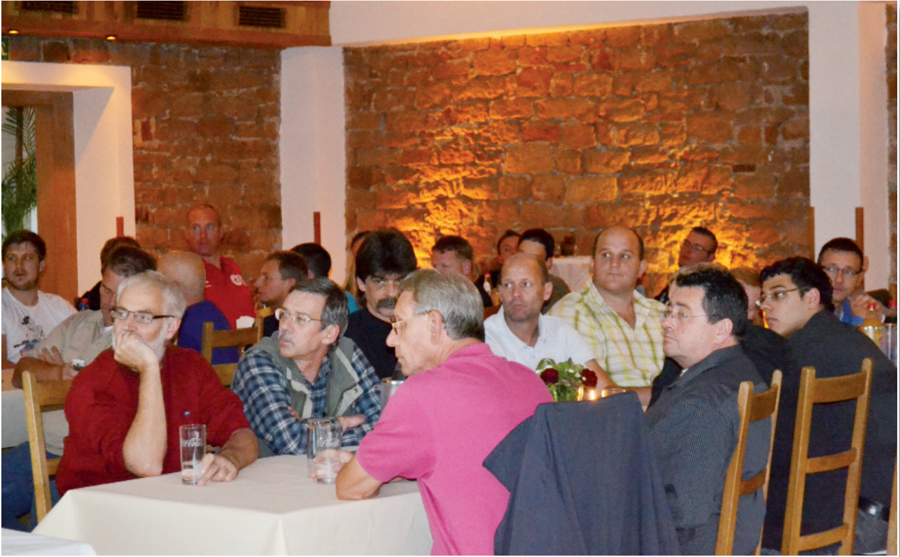
Die Mitarbeiter der Firma Eisen Throm GmbH .