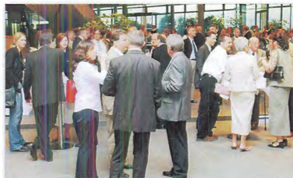
Diskussions- und Gesprächsforum