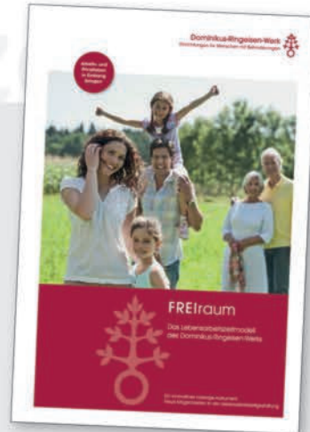
FREiraum Mitarbeiterbroschüre zum Lebensarbeitszeitmodell des Dominik-Ringeisen-Werks

„Die Infoveranstaltung hat mich beeindruckt. Insbesondere, dass der Arbeitgeber ein solches Modell anbietet. Da ich noch so jung bin, habe ich viele Möglichkeiten dieses Modell einzusetzen.“