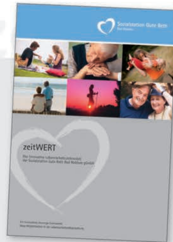
zeitWERT Mitarbeiterbroschüre zum Lebensarbeitszeitmodell der Sozialstation Gute Beth Bad Waldsee gGmbH